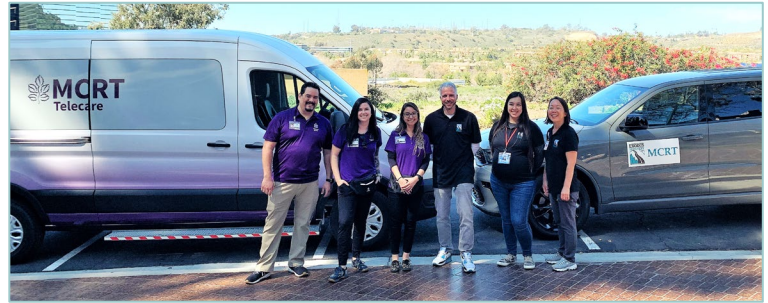
Providers of the County's Mobile Crisis Response Team

The Mobile Crisis Response Team (MCRT) program offers 24/7 mobile support to people experiencing a mental health or substance use-related crisis where they are, when they need it.