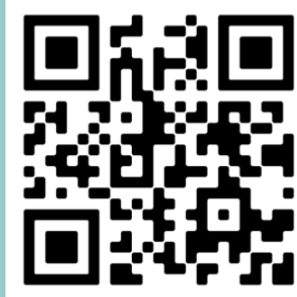
Escanee para ver más información del MCRT